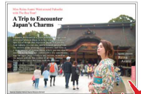
電子雑誌からニッポンの魅力を海外へ