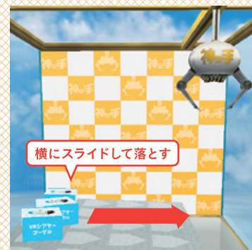
スライドステージ