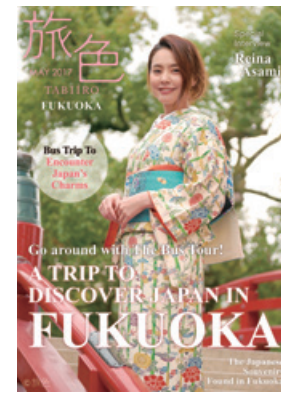
「旅色～福岡特集～」英語版