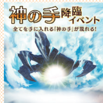
エネルギーチャージで必ずゲット