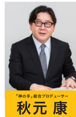
「神の手」総合プロデューサー 秋元 康