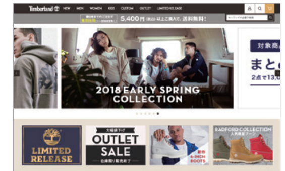
ティンバーランドオンラインショップ