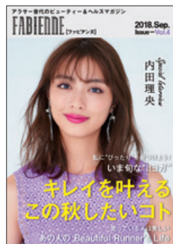
アプリ専用の ビューティー&ヘルスマガジン FABIENNE (株)メディアハーツ