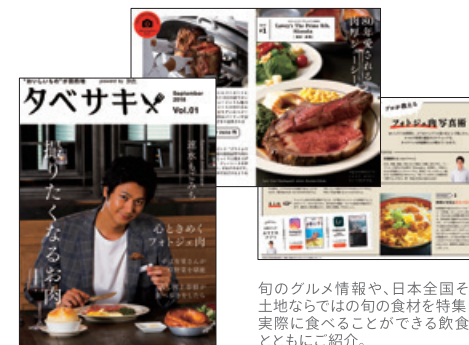
旬のグルメ情報や、日本全国その 土地ならではの旬の食材を特集し、 実際に食べることができる飲食店 とともにご紹介。

これまでに培ったコンテンツ力を生かし、「旅色」の新プロジェクト として、食をきっかけとした旅のスタイルを発信する電子雑誌「タベ サキ」を創刊。「旅色」に掲載中の飲食店様の満足度向上を図って います。今後も、創刊から12年目を迎えた「旅色」のブランド力を 活用し、旅行に関連する企業や地方自治体とのタイアップによる 別冊版「旅色」の発行に努めると同時に、「旅色」の媒体力をさらに 強化し、広告掲載売上の増加も図ります。