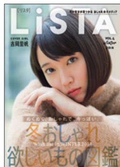
通販直結型の 無料ファッションWEBマガジン LiSTA CROOZ SHOPLIST(株)、(株)幻冬舎

当社電子雑誌の需要が高まっております。今後も、企業 や地方自治体へご提供する電子雑誌の拡大を目指 してまいります。