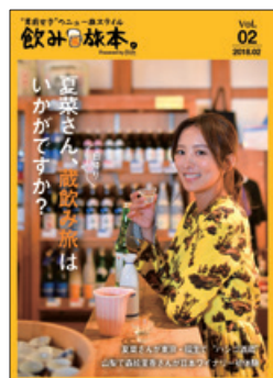
お酒とおつまみを楽しむ “飲み旅”にフォーカスした旅色の別冊 飲み旅本。 国分グループ本社(株)