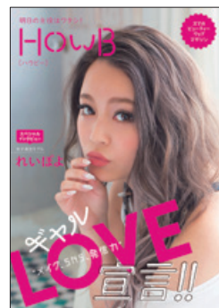
スマホ専用 ビューティーWEBマガジン HowB 湘南美容クリニックグループ