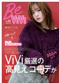
スマホで読める 無料ファッションWEBマガジン BeViVi (株)講談社、(株)楽天