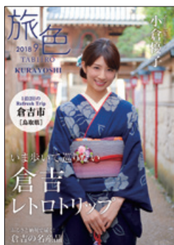
大人の女性の旅を ナビゲート 旅色 地方自治体

広告掲載クライアントの獲得 新規掲載+既存クライアントからの追加受注も含め、 さらに営業を強化