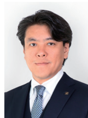
株式会社ブランジスタ 代表取締役社長

当社は、2020年に創業20周年を迎え、上場5年目の年となります。今後も、株主の皆様のご期待にお応えできるよう、全社一丸となってこの苦境を乗り越え、さらなる社業の発展に努めてまいります。