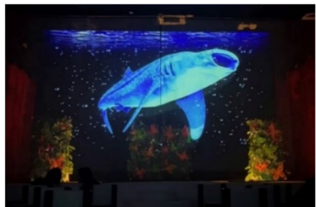
セブ島「WHITENOTE」導入イメージ

このたび、世界29カ国の海外旅行、オリジナルツアーなどを取り扱い、10年連続顧客満足度ランキング旅行会社第1位の実績がある(月刊誌マリンダイビング 2007～2017年 年間ランキング調べ) 株式会社エス・ティー・ワールドから委託を受け、2024年11月頃にカンボジア王国にオープン予定のカンボジア最大級となるレストラン「THE LABYRINTH(ザ・ラビリンス)」へ進化系3Dホログラムを導入することとなりました。株式会社エ